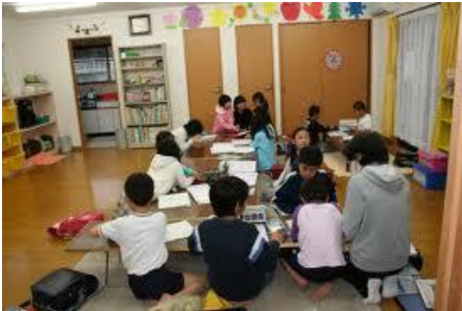
(上記は学童保育のイメージ写真)

答：計画実施となる平成27年度からは子ども・子育て会議として条例設置も含め検討する。